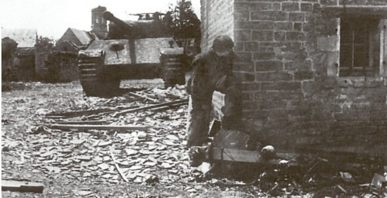
Le 25 juin 1944, bataille au centre du village de Fontenay le Pesnel

Un cimetière britannique comportant 520 tombes y rappelle ces moments importants de la Libération de notre pays.